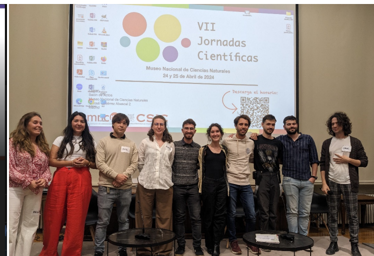
Claustro MNCN 27-05-24, Vicedirección de Investigación