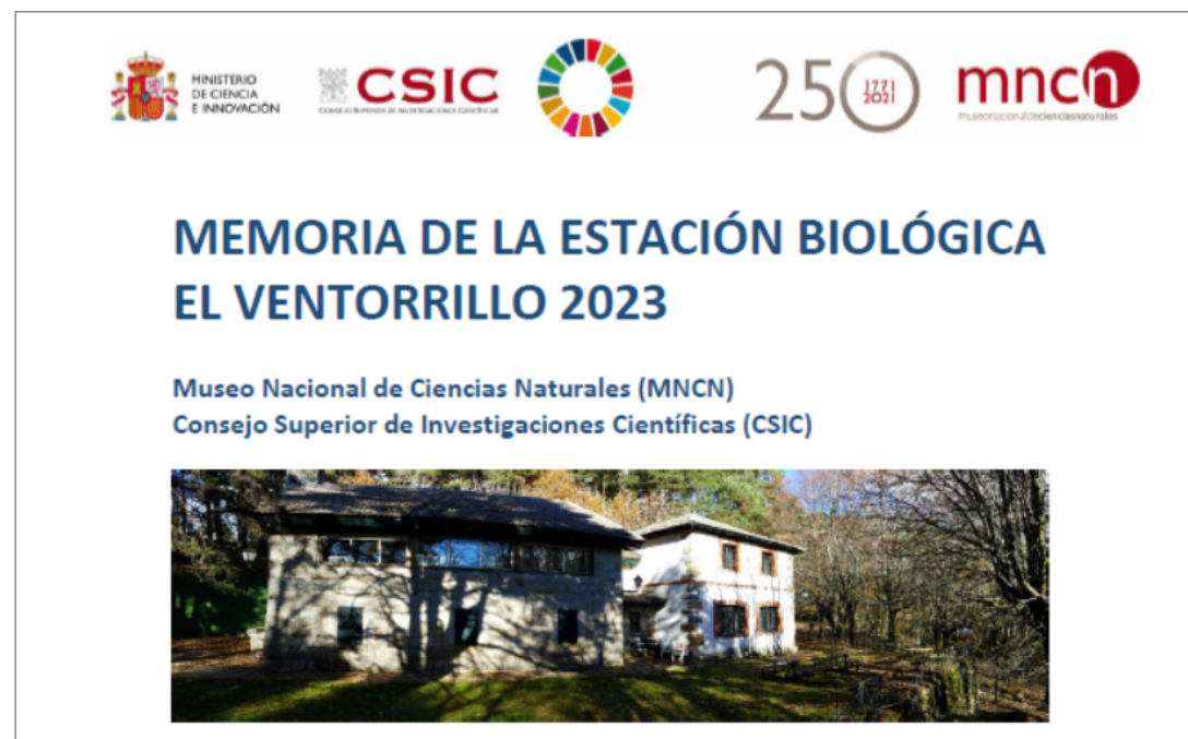
Claustro MNCN 27-05-24, Vicedirección de Investigación