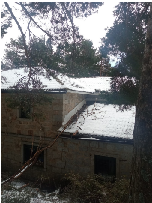
Obras de reparación finalizadas