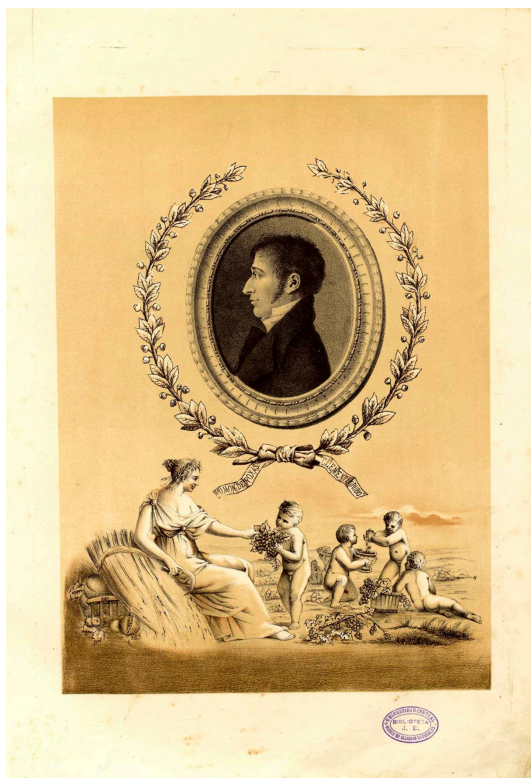
Figura 2. Retrato de Rojas Clemente.