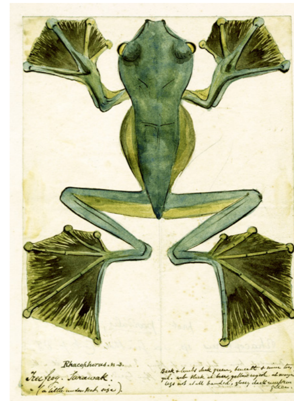
Rana voladora de Wallace, Rhacophorus nigropalmatus .

El siguiente espacio está dedicado su vuelta a Inglaterra, a su relevante papel en la difu-