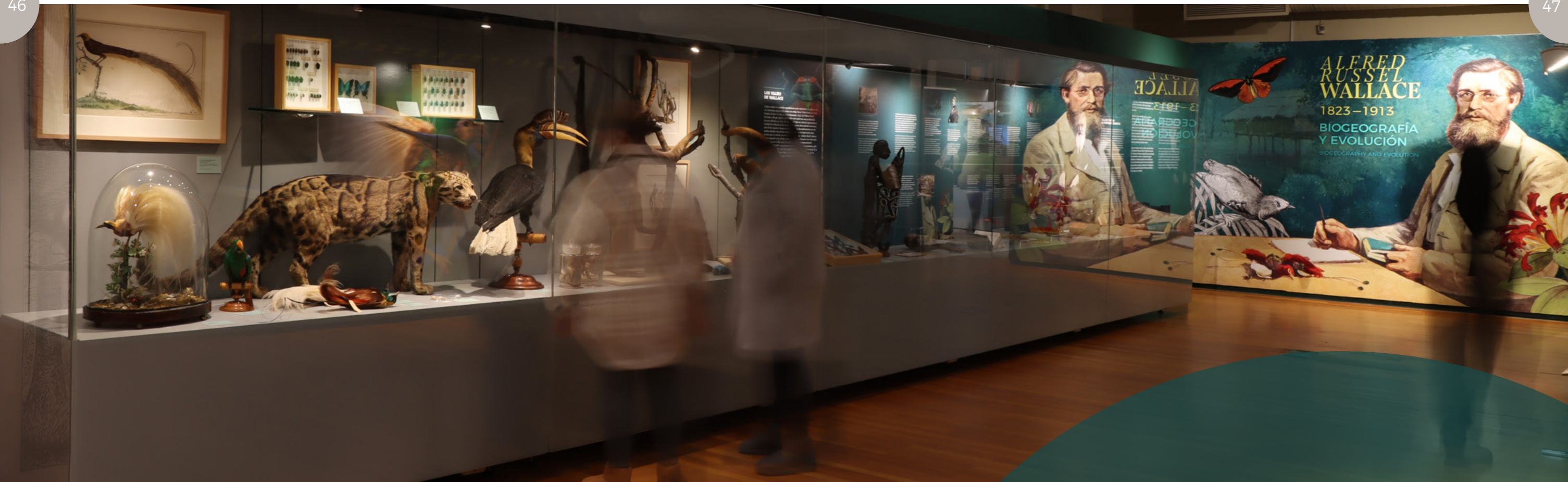
Panorámica de una de las salas de la exposición.

El audiovisual La línea de Wallace es una recopilación de lo expuesto que permite al visitante reflexionar tanto sobre lo que ha visto, como sobre la figura científica de Wallace ●