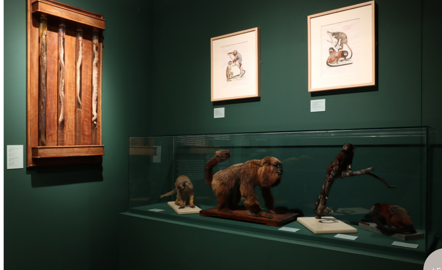
Monos y serpientes venenosas de la Amazonía.

●● Por primera vez el MNCN cuenta con una sala inmersiva donde el visitante se sumerge en una selva tropical del archipiélago malayo y puede contemplar algunas especies que observó Wallace durante sus expediciones