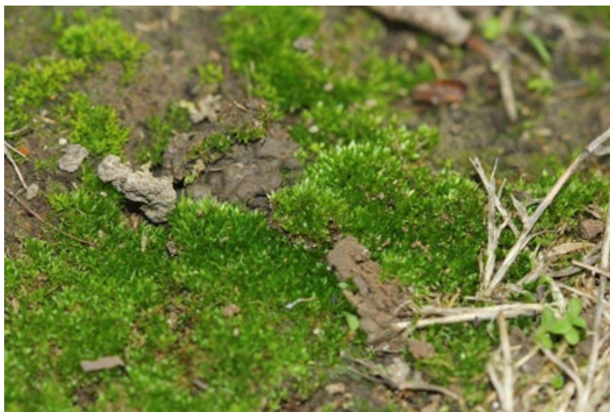
Cobertura de musgos en suelos de Francia / José Luis Blanco Pastor

Los musgos se encuentran en muchos lugares de la tierra, desde los desiertos hasta los bosques boreales, pasando por las regiones árticas y antárticas. Sin embargo, en comparación con las plantas vasculares (plantas con tallos, hojas y raíces), sabemos mucho menos sobre el papel que juegan en la biodiversidad y el funcionamiento de nuestros suelos. “Los musgos del suelo suelen pasar desapercibidos a nuestros ojos. Este estudio constituye la primera prueba a escala mundial de que estas diminutas plantas proporcionan numerosos servicios ecosistémicos que van desde el secuestro de carbono hasta una mayor disponibilidad de nutrientes y descomposición de materia orgánica o la reducción de la presencia de patógenos de plantas”, indica Manuel Delgado Baquerizo, responsable del Laboratorio de Biodiversidad y Funcionamiento Ecosistémico (BioFunLab) del IRNAS-CSIC.