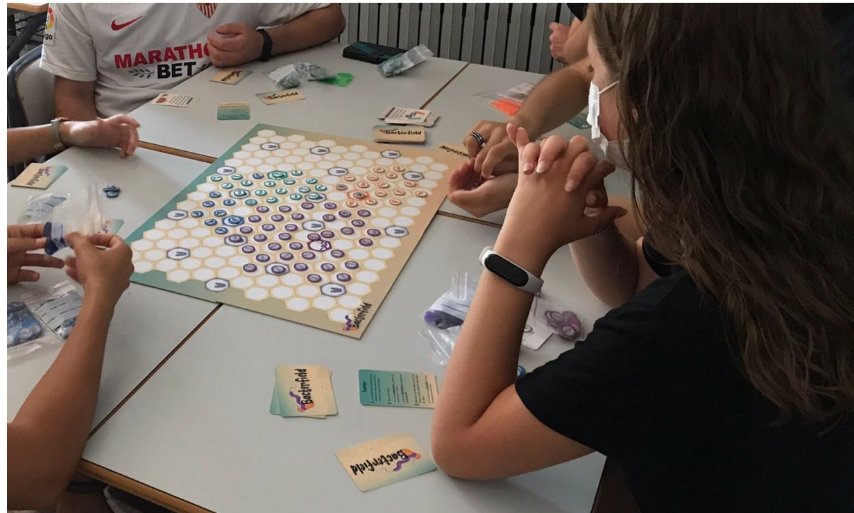
Uno de los grupos de escolares probando Bacterfield