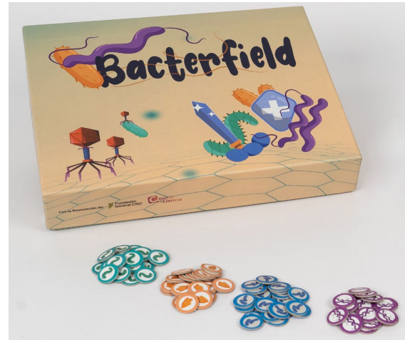
Así es Bacterfield y sus piezas.

res. Estas bacterias son el elemento principal del juego, ya que podrán actuar como en la vida real duplicándose, adquiriendo distintos genes o produciendo biofilm para protegerse. Cada jugador contará además con la ayuda de las cartas de juego, que le permitirán luchar contra otras bacterias infectándolas con virus o eliminándolas con agentes antimicrobianos. ¡A qué esperas para reunir tus bacterias y ganar la batalla!