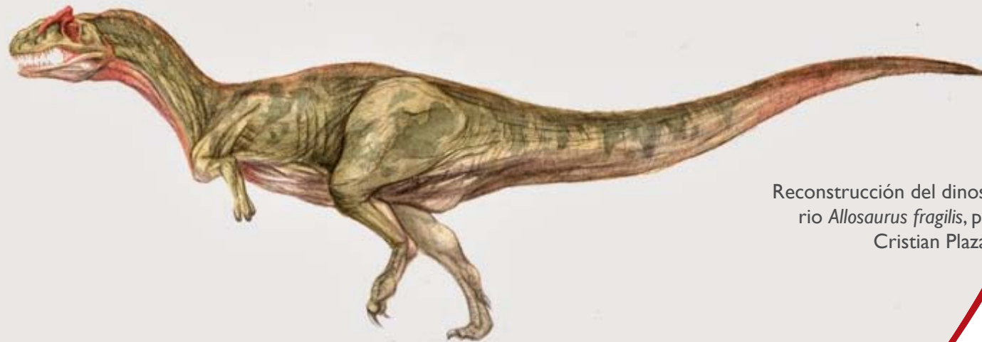
Reconstrucción del dinosaurio Allosaurus fragilis , por Cristian Plaza.