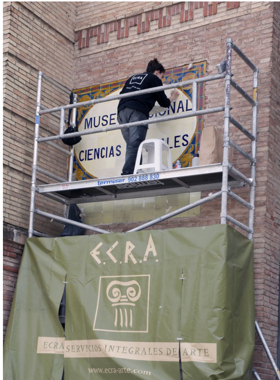
Labores de restauración en el mural de Zoología.

de El Retiro; los que embellecen la Escuela Técnica Superior de Ingenieros de Minas y Energía; o el Palacio de Fomento, sede principal del actual Ministerio de Agricultura, Alimentación y Medio Ambiente. En sus intervenciones Zuloaga empleó profusamente, y con gran originalidad, la cerámica decorativa. El mosaico de la entrada de Geología fue realizado años más tarde que el panel de Zoología en los talleres de los hijos de Zuloaga.