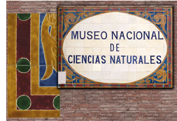
Detalle y situación de los azulejos repuestos.

La representación de estos seres mitológicos, grifos que aquí han cambiado su cabeza de águila por la de león, se empleaba para señalar el lugar en donde se custodiaban las riquezas, en nuestro caso, las relacionadas con el conocimiento de las Ciencias Naturales aludido en la rotulación. Y así como los grifos tenían encomendada la vigilancia de las piedras preciosas de los tesoros de Apolo, en estas piezas también protegen las joyas que