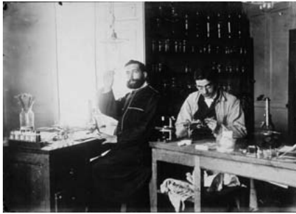
Celso Arévalo y Pons en su laboratorio en 1906

amplificadas por el escaparate mundial de internet. La propensión humana a buscar confirmación en vez de refutación, un aspecto clave del pensamiento científico, así como la tendencia también humana de aferrarse a creencias confortables y a generalizar sobre evidencias escasas son las principales causas del arraigo y expansión del pensamiento pseudocientífico . Este modo de pensar nos lleva por ejemplo a realizar asociaciones en función de la apariencia y a confundirnos sobre causa y efecto. A esta tendencia bastante comprensible hay que sumar, o quizá multiplicar, el efecto de la actitud de gobernantes y personas influyentes que descartan conscientemente el conocimiento científico para apoyar consignas, ideas e incluso interpretaciones de los datos que encajan con sus intereses. Y